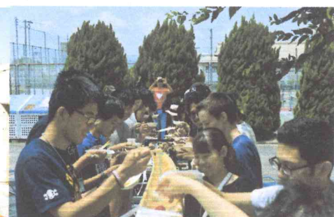
(2019.6 留學生會館流水素麵派對)