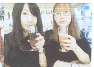
(2019.6 愛媛 松山)