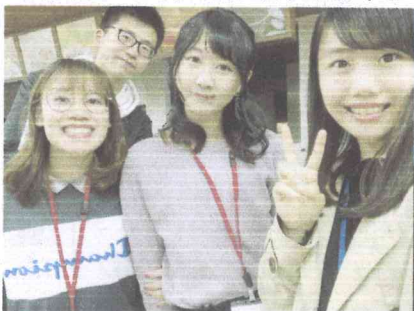
(2019.4 香川大學留學生派對)

其實我從還沒進來真理大學之前就立志要好好拚成績將來能夠去日本交換學生,最後也如願上了我的第一志願香川大學。雖然在四國交通難免有些不方便,但是我覺得這是最適合我居住的地方。光是瀨戶內海的美景就已經夠吸引人了。剛好我最喜歡的歌手也是四國出身 更沒有理由不選擇來四國!香川大學真的很照顧留學生,每一學期都會為新進留學生準備留學生派對跟留學生校外教學。香川大學也是一所對地方很有貢獻的大學。所以我覺得香川大學令我很驕傲。雖然我們只在這邊待了一年,但是在這邊的一年對留學生來說一定是最寶貴的回憶!如果沒有來到香川大學,我也不能交到我這輩子最珍貴的好朋友,所以我很感謝真理大學很用心在做交換學生這塊,也很感謝香川大學用心對待,照顧所有的留學生。