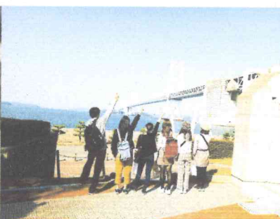
(2018.11 留學生課外教育行事)